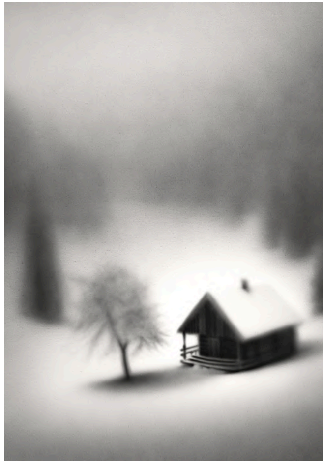
NOT FOUND 2024 Acrílico sobre lienzo 130 x 97 cm