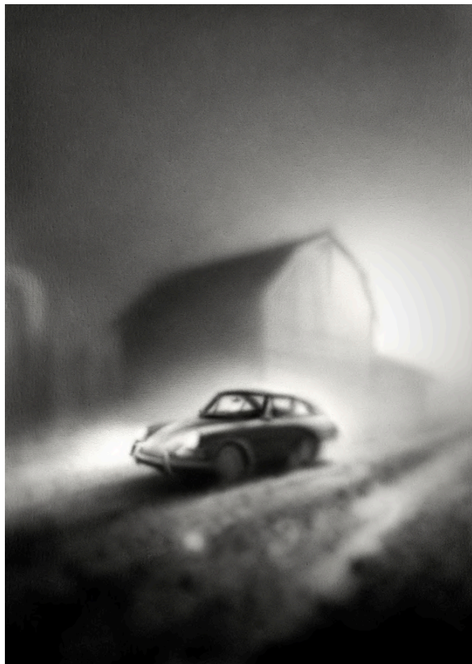
COLD 2024 Acrílico sobre lienzo 70 x 50 cm