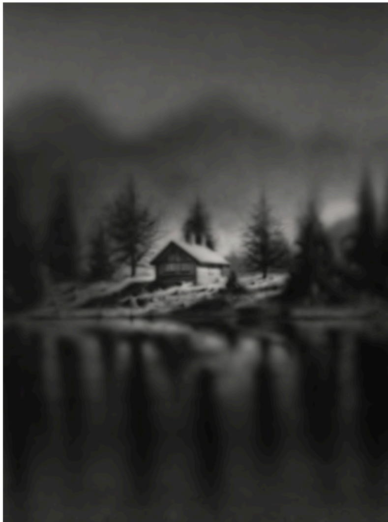
THREE SISTERS 2024 Acrílico sobre lienzo 130 x 97 cm