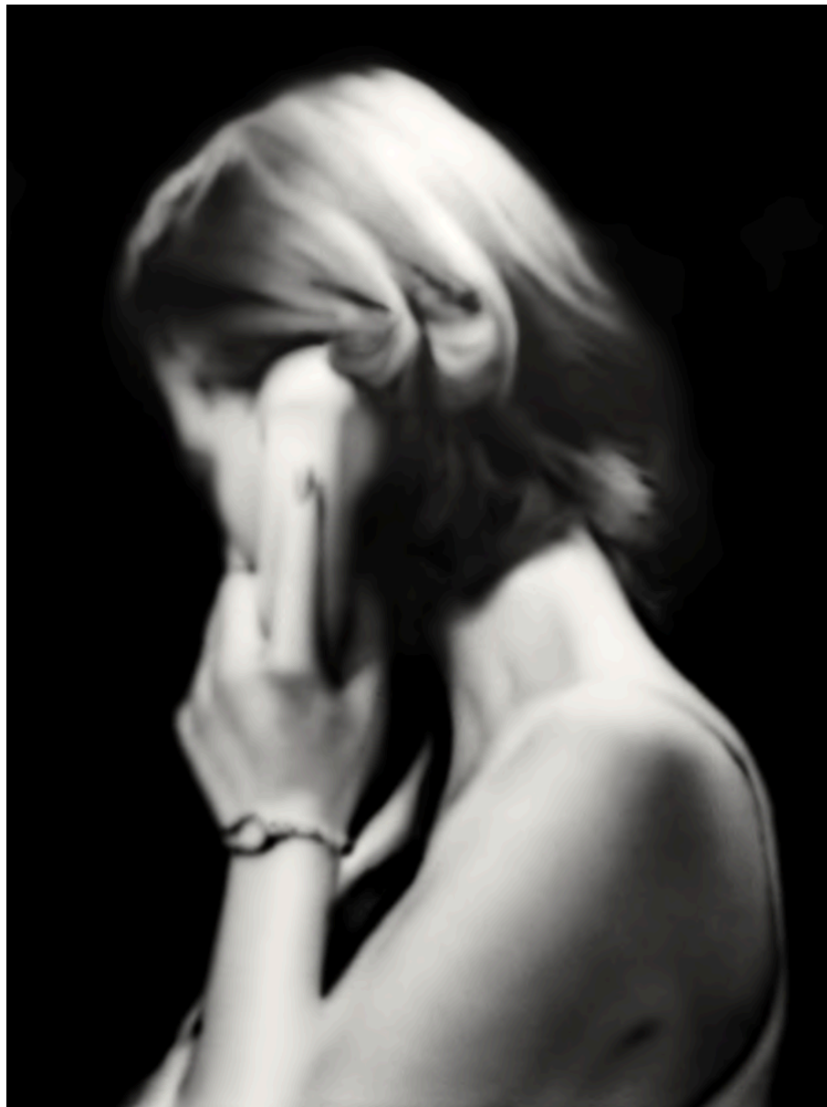
TRIPEL 2024 Acrílico sobre lienzo 130 x 97 cm