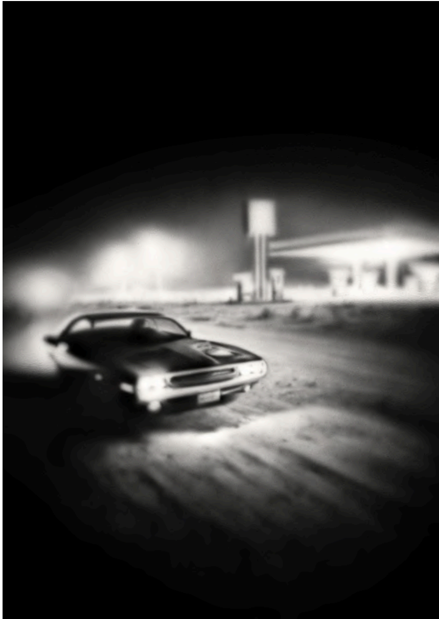
NEW FRIEND 2024 Acrílico sobre lienzo 130 x 97 cm