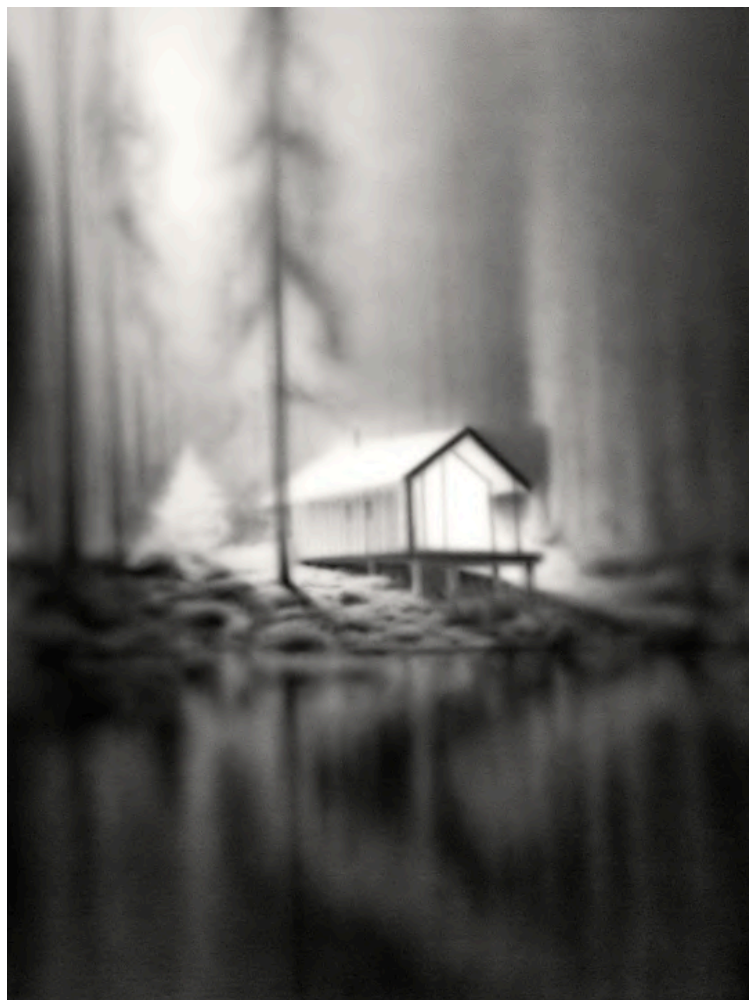
NO PHONE 2024 Acrílico sobre lienzo 130 x 97 cm