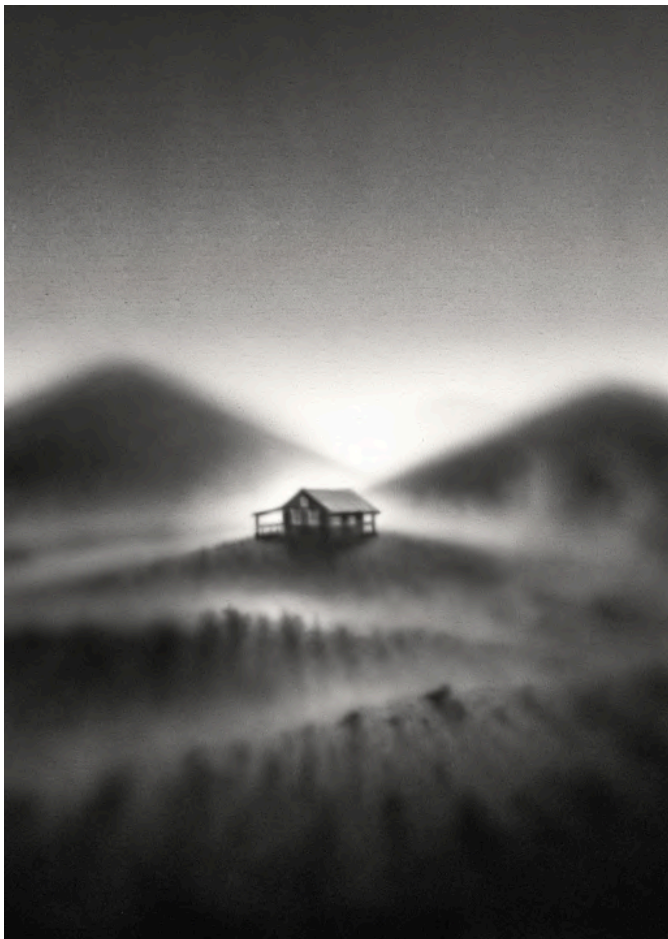
SECOND DAY 2024 Acrílico sobre lienzo 130 x 97 cm