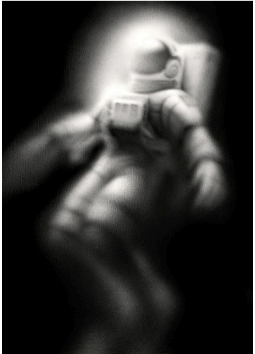
GREY TRINITY 2024 Acrílico sobre lienzo 70 x 50 cm