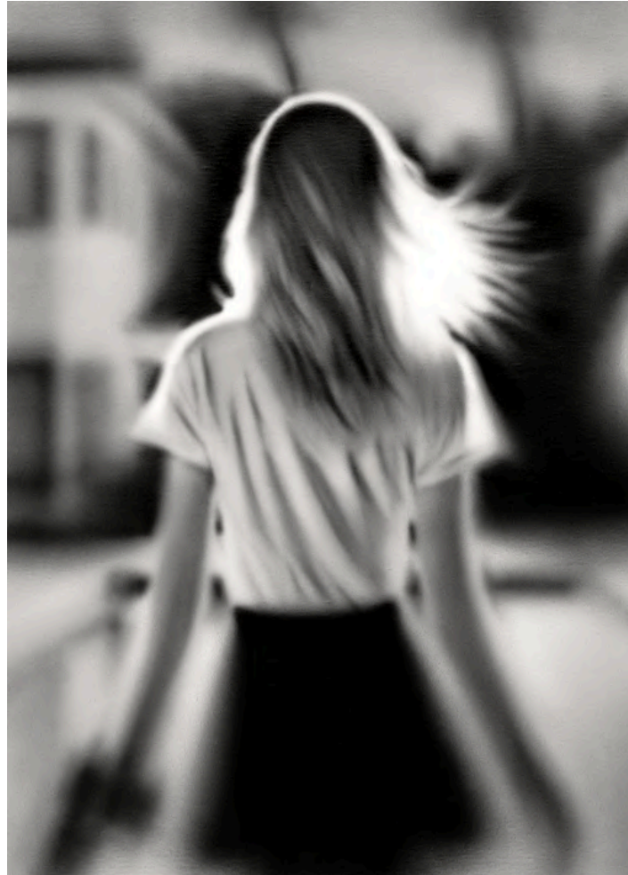
ONE 2024 Acrílico sobre lienzo 70 x 50 cm