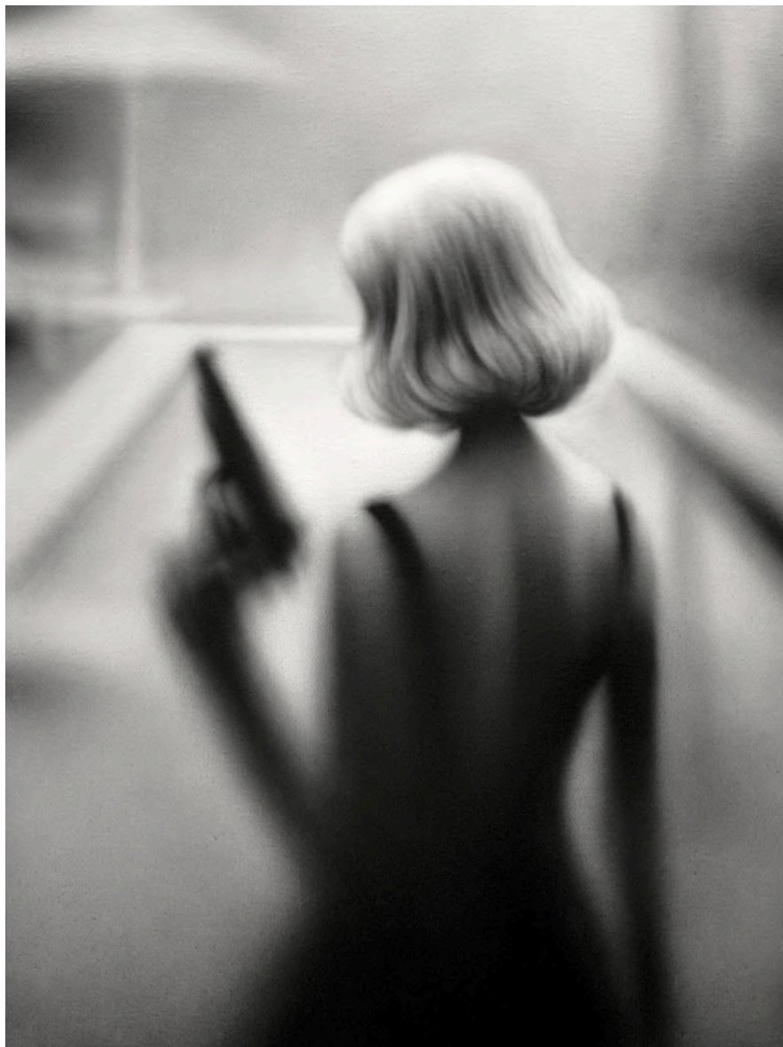
THE UMBRELLA 2024 Acrílico sobre lienzo 70 x 50 cm