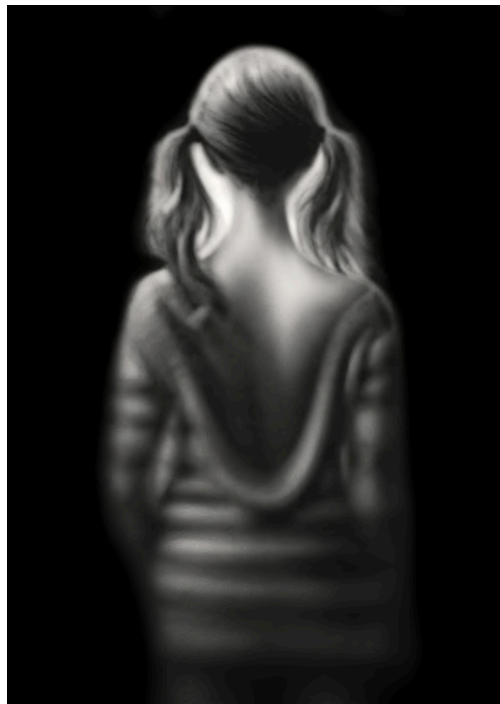
S 2024 Acrílico sobre lienzo 130 X 97 cm