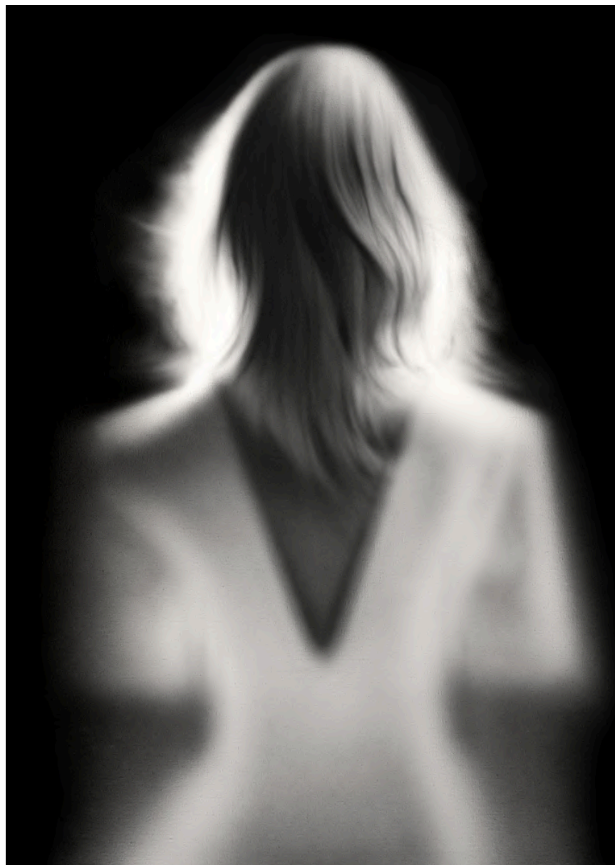
ELECTRIC SISTER 2024 Acrílico sobre lienzo 130 x 97 cm